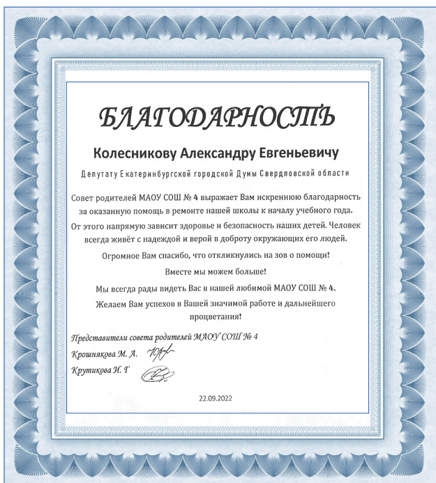
Благодарность от родительского комитета школы №4