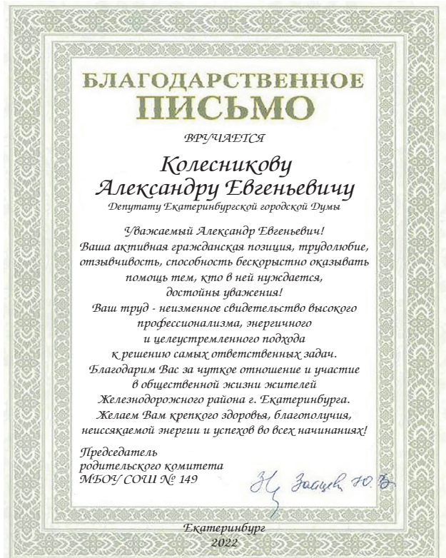
Благодарственное письмо от родительского комитета школы №149