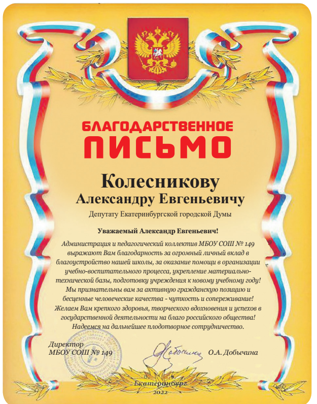
Благодарственное письмо от директора школы №149