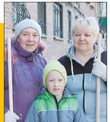
↖ ↑ Надеждинская, 9