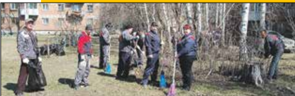
Азина, 21/Мамина-Сибиряка, 9 ↓ →