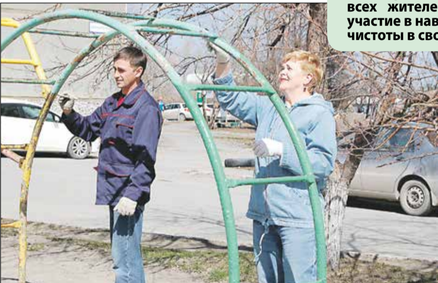
↓ Автомагистральная, 33

УК «РЭМП Железнодорожного района» благодарит всех жителей, кто принял участие в наведении чистоты в своем дворе!