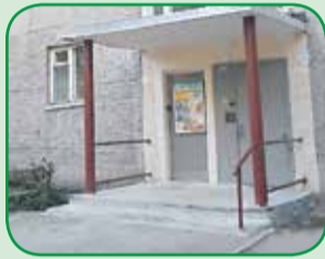
Ул. Гражданская, 2